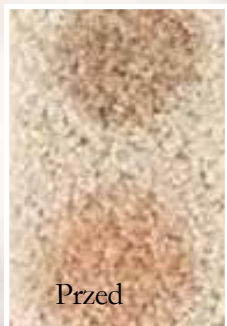
czerwone wino/ sok pomarańczowy